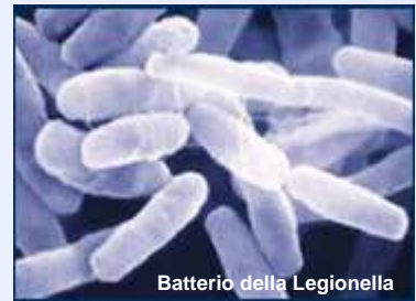
Batterio della Legionella