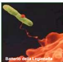
Batterio della Legionella

Settori e siti maggiormente esposti al rischio di contaminazione sono: